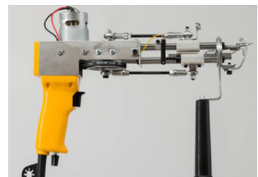
Deux pistolets de tufting