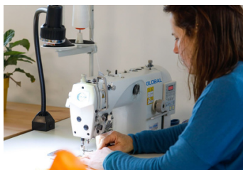
Machine à coudre piqueuse double entraînement