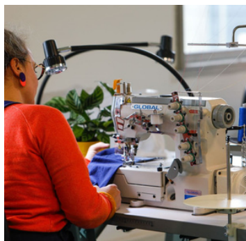
Recouvreuse FB 3603-64 B