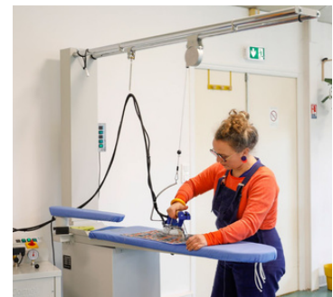
Centre de repassage complet disponible en libre service.