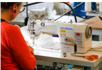
Machine à coudre piqueuse simple entraînement