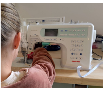
Machine à coudre semi-pro Janome