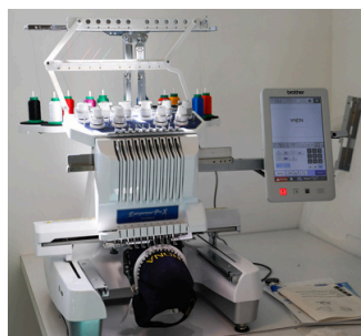
Brodeuse numérique PR680W