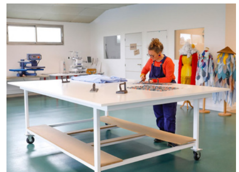
Table de coupe